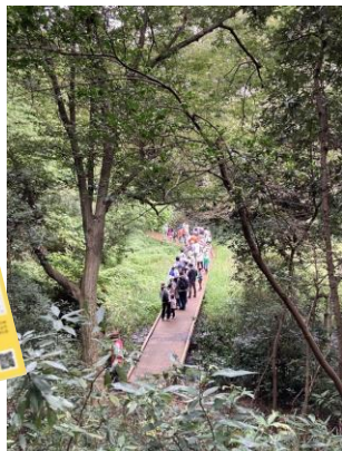
自然観察会(AM)たくさんの方に ご参加いただきました!