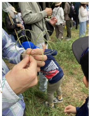
メヒシバで草花遊びも!