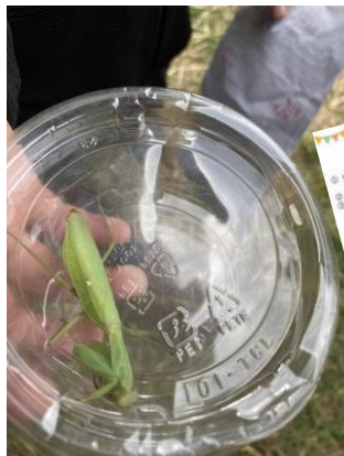
ハシビロカマキリはお腹 に白い斑点があります