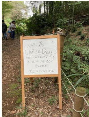
手書きの看板でお出迎え

作業は大畔の森では木道の清掃、葛の除草、畑作業(大根間引き、ネットかけ、オクラの種収穫)を、西初石小鳥の森では清掃を行いました。