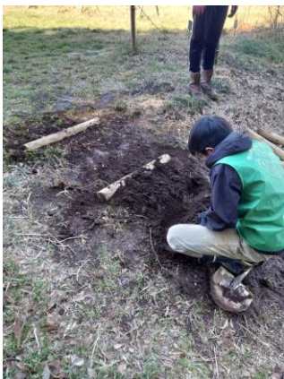
草原から田んぼへ降りる場所へ階段を作りました。