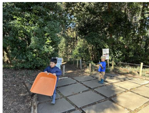
西初石小鳥の森の清掃。子ども会員も一生懸命掃除頑張りました！