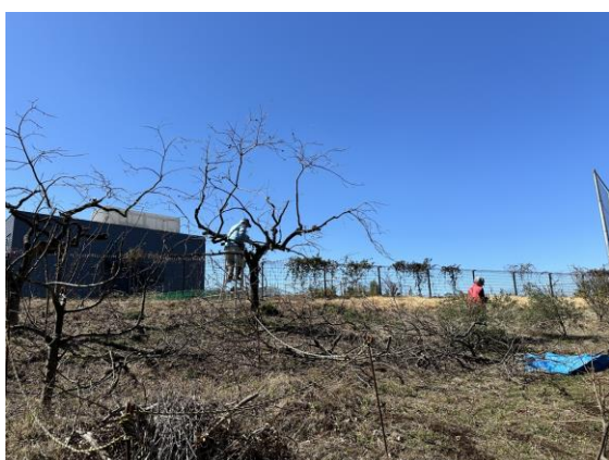
中学校脇の柿の木の剪定と枝の片付け。