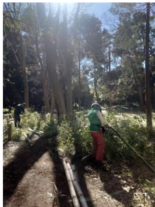
強風が続き、古い竹が立て続けに折れています。今日も竹の片付けを行いました。