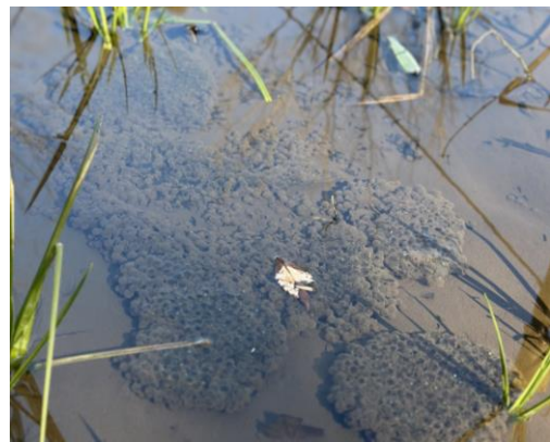
ニホンアカガエルの卵塊が、3週間前よりも増えていました！