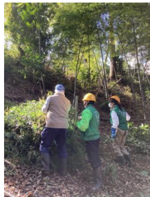
草刈り。足場の悪い斜面だったので、注意を払って行いました。